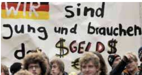
„Tarifvertrag statt Bafög“ – eigentlich eine gute Idee